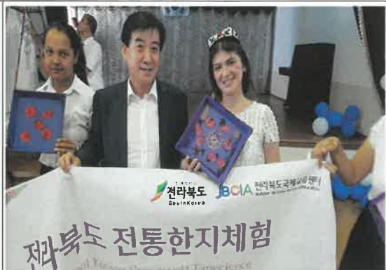
세르겔리 산업학교 전통한지체험