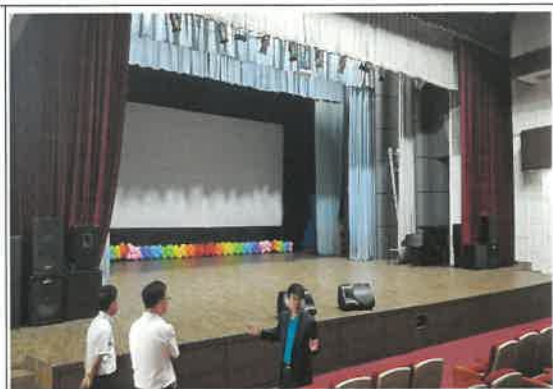
카자흐스탄 문화예술인 간담회 및 알마티 한국교육원 공연장