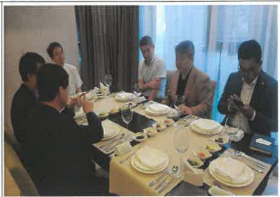
우즈베키스탄 및 카자흐스탄 고려인협회 간담회