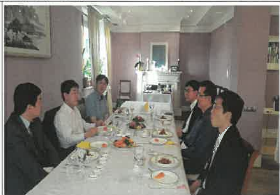
우즈베키스탄 및 카자흐스탄 공관 간담회