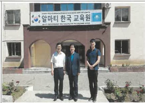
우즈베키스탄 및 카자흐스탄 알마티 한국교육원 방문