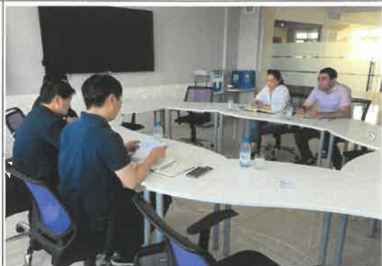
카자흐스탄 튜란대학교 방문