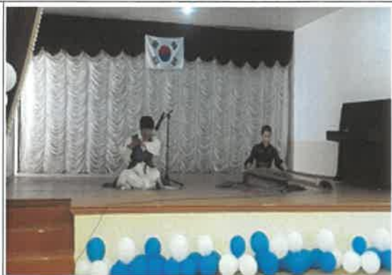
세르겔리 산업학교 전통문화 공연