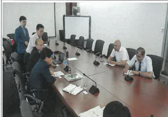
우즈베키스탄 국영자동차그룹 방문