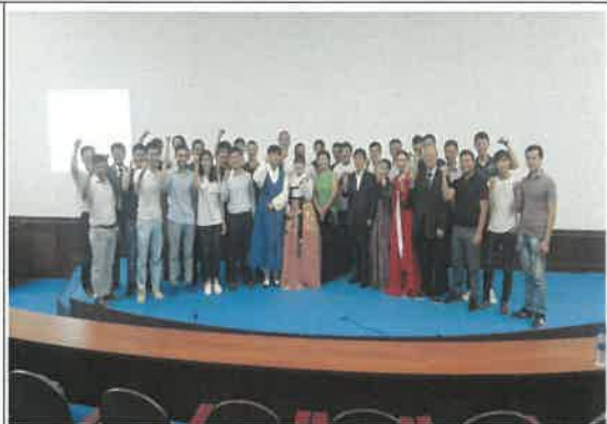
투린대학교 전통문화 공연