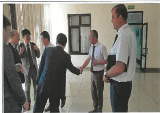
우즈베키스탄 교육부 방문